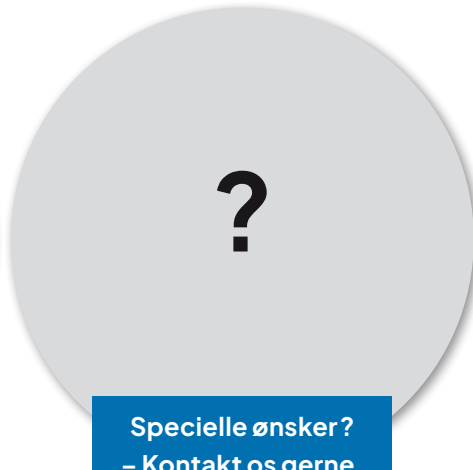
Specielle ønsker? – Kontakt os gerne.