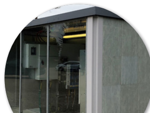
Lay Light Fiberline