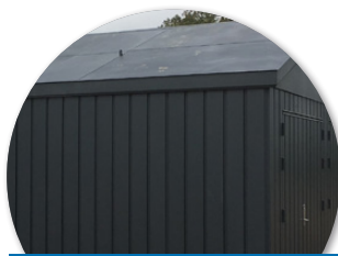
Zinkmagnesium med saddeltag