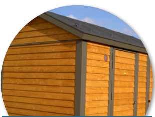
Træbeklædning med saddeltag